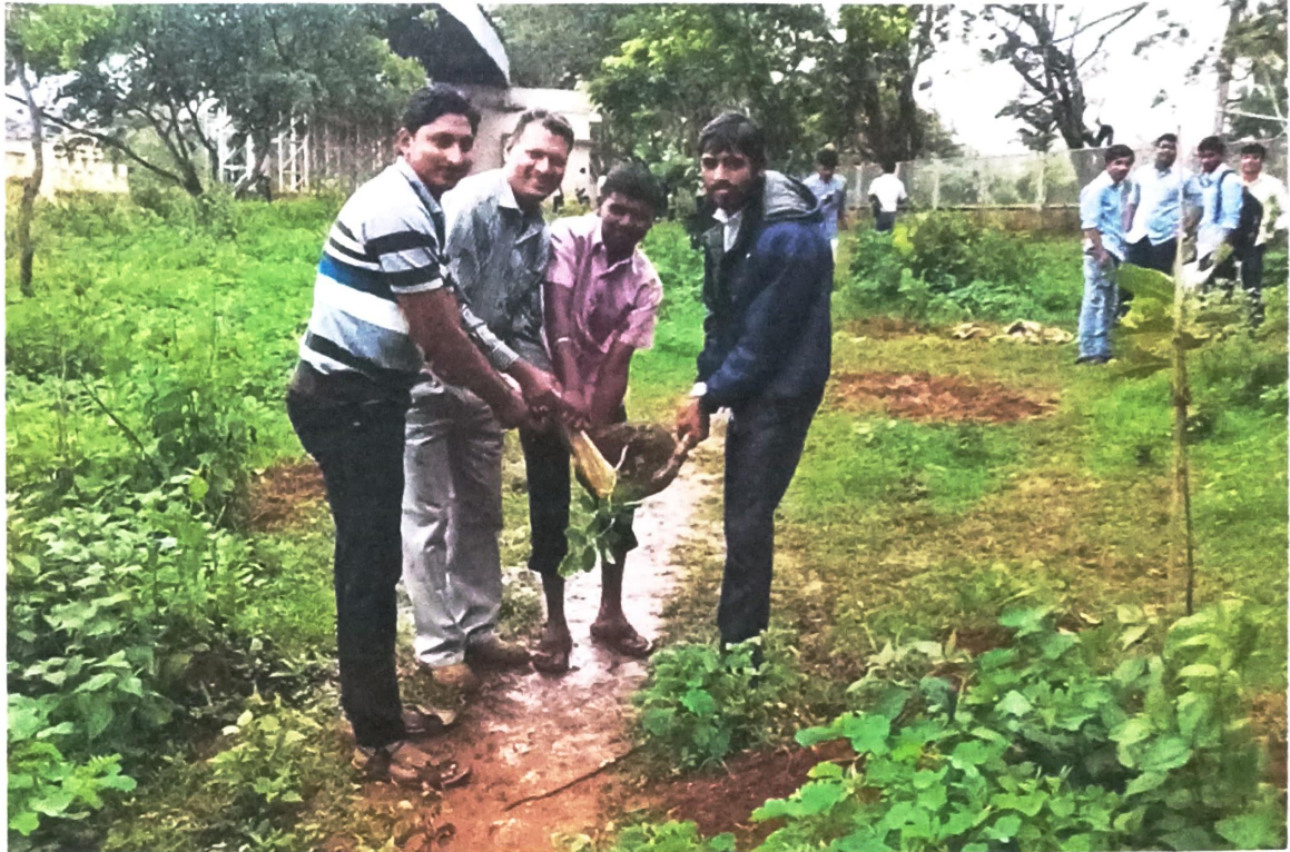
N.S.S. Volunteers participating in planting the tree.